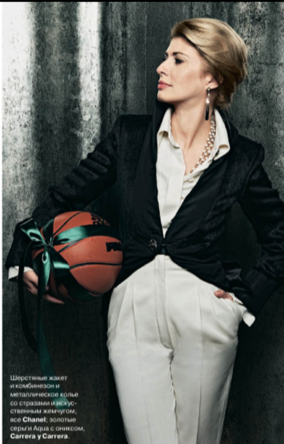
Шерстяные жакет и комбинезон и металлическое кольцо со стразами и искусственным жемчугом, все Chanel; золотые серьги Aqua с ониксом, Carrera y Carrera.